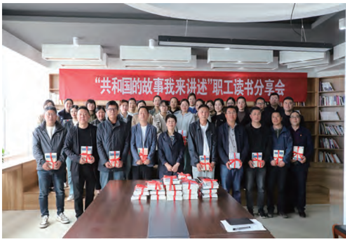
人间四月，墨香氤氲，第二十九个世界读书日如约而至。4月23日，灌西投资公司工会开展“共和国的故事，我来讲述”读书分享会，活动现场各基层单位部门14名职工代表分享读书心得、畅谈读书感悟，从知识的海洋中汲取奋进的养分。（杨婕）

以赛促建提质效。竞赛的冲锋号角吹响后，激发了广大职工的工作积极性，各部门和班组以“开局就是决战、起步就要冲刺”的姿态迅速掀起生产大干热潮。下一步，该工会将紧盯年度重点工作，持续深入开展劳动竞赛活动，聚焦周密部署、提质增效、勤督严查、凝心聚力等四个方面重要内容，着力提升竞赛质效，加快竞赛成果转化，为推动企业高质量发展贡献力量。（神特宣）