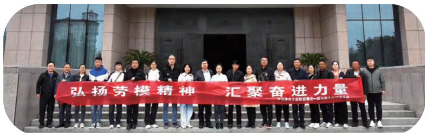
集团工会“弘扬劳模精神,汇聚奋进力量”研学活动