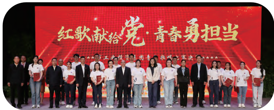
集团团委“红歌献给党 青春勇担当”青年歌唱比赛