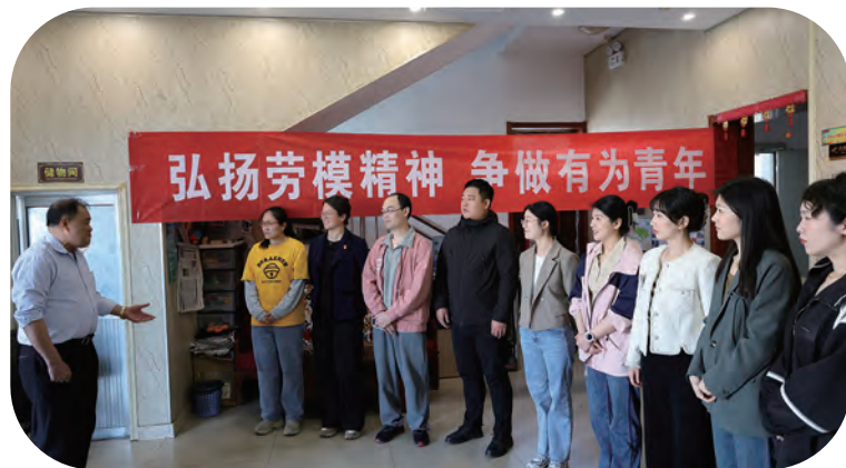
金航公司“弘扬劳模精神”争做有为青年:劳模与青工交流研讨活动