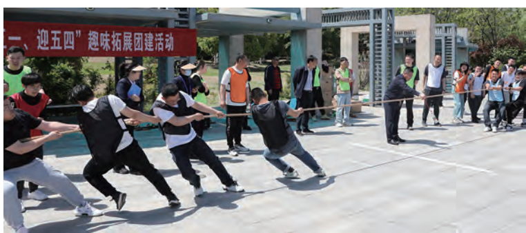
供电公司“庆五一、迎五四”团建活动