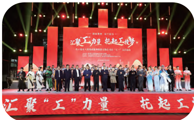
灌西公司“汇聚‘工’力量、托起工报梦”庆“五一”文艺演出

提出分丝叉定点定制方案,对生产过程中的丝路矫正升级,有效降低丝束单丝缠辊概率,提高产品优等品率。她撰写专利十余件,已授权专利6件,2022年撰写的《超高分子量聚乙烯纤维模量影响因素研究》论文,成功发表在《高科技纤维与应用》期刊上,并获得化纤协会优质论文二等奖。