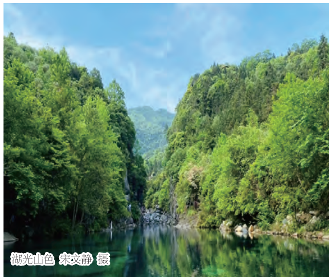
湖光山色

劳动创造美不仅存在于我们的生活中，也存在于我们的心灵深处。让我们用勤劳的双手去创造美，用智慧和勇气去追求梦想。在这个过程中，我们将不断发现生活的美好，不断感受到劳动的力量和价值。让我们一起欣赏劳动的美，传承劳动的精神，一起用劳动创造美，用爱与希望点亮生活的每一个角落。