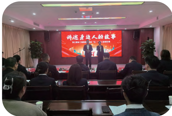
集团公司“讲述身边人的故事”职工演讲比赛