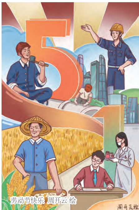
劳动节快乐 周开云 绘

三月的天，春寒略带阴霾；四月的雨，缠绵而凄婉。五月，阳光开始变得有温度，微风不燥，草木繁盛。“五