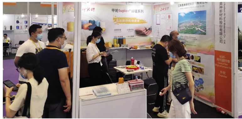
7月15日,为期三天的2020大湾区国际纺织纱线博览会在深圳国际会展中心成功举办...