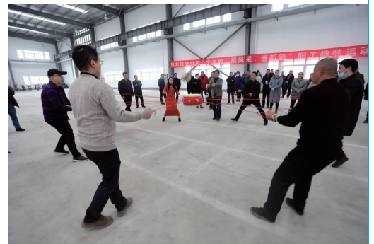
12月28日下午,台北投资公司举办以拔河、同心击鼓、企鵝漫步、快乐点球等四个项目为内容的“庆丰收、展风采、谱新篇”元旦职工趣味运动会,在欢歌笑语中展示台北职工奋勇争先、勇立潮头的精神风貌。(韩挺)