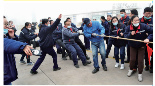
12月28日-30日,氨纶公司举办第一届职工文体周暨迎新春节庆祝活动,广大干部职工在拔河、跳绳、掷蛋、踢毽子、趣味活动等项目中展开角逐,鼓士气、聚人心,迎接新的一年到来。(氨纶宣)