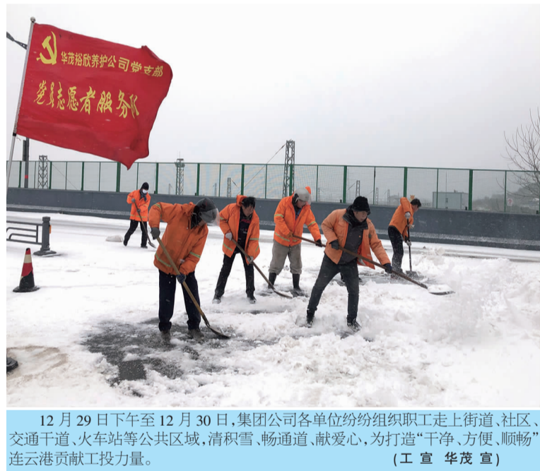
12 月 29 日下午至 12 月 30 日,集团公司各单位纷纷组织职工走上街道、社区、交通干道、火车站等公共区域,清积雪、畅通道、献爱心,为打造“干净、方便、顺畅”连云港贡献工投力量。(工宣 华茂宣)