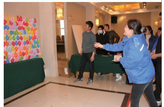
12月28日至31日,利海化工公司举办“庆元旦·迎新春”文体活动周系列活动,包括众星捧月、飞镖射气球、抛绣球、掷蛋、台球等7个比赛项目,营造了浓厚的节日氛围。图为飞镖射气球比赛。