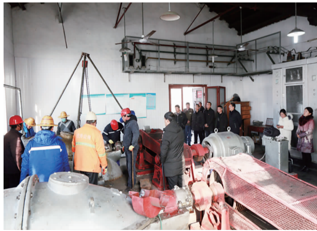
12月25日上午,徐圩投资公司在生产服务中心封跳扬水站举行安全生产管理现场观摩交流会,职工代表等 20 余人在现场通过听、看、问、谈方式,对机械维修安全管理、生产操作、班组安全文化创建等内容进行了交流。(胡可志)

▲近日,徐圩投资公司工会为开展好 2020 年“恒爱行动·百万家庭亲情一线牵”公益活动,各分会 25 余名“爱心妈妈”参与爱心毛衣编织活动,当前完成毛衣 32 件。(刘凡榕)