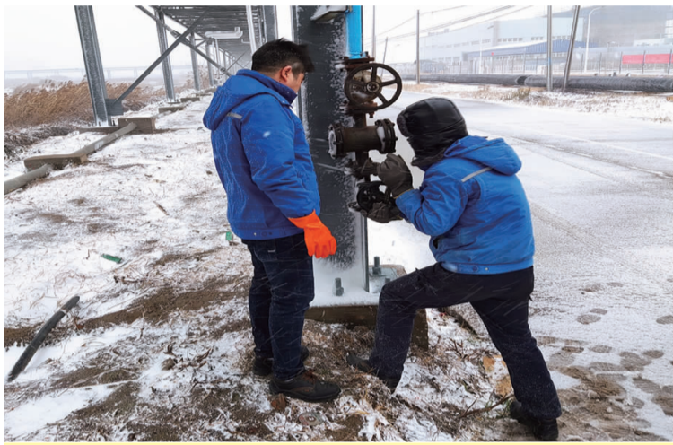
12月29日,天空下起了鹅毛大雪,给利海化工公司生产造成了不便。该公司装置员工坚持在雪中巡查、打外销罐、检维修、完成抽液等各项扫尾工作,确保年内各项生产任务圆满完成。(梁娟 郑东旭)

全力以赴抓安全,项目推动不断增强。全面建立安全管控秩序,健全标准,先后开展“隐患排查月”“安全生产月”“一把手安全咨询会”等一系列活动,开展电工、扒盐等安全技能培训,创设安全督导亭,先后为塑布、原盐投保,提高抗灾能力。全年整改安全隐患 140 处,整改费用 100 余万元。同时印发《工程管理办法》,强化工程现场实施管理,全年累计完成投资 222.75 万元。(靳静)