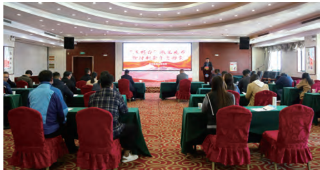
11月4日，台北投资公司党委召开2022年“书记项目”成果发布暨冲刺全年誓师会，进一步动员广大党员当虎将、争闯将、创名将，奋勇争先，不断“发挥两个作用”，决战冲刺全年“收官战”。（北宣）