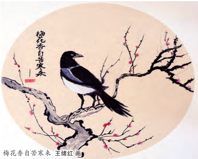
梅花香自苦寒来 王绪红画