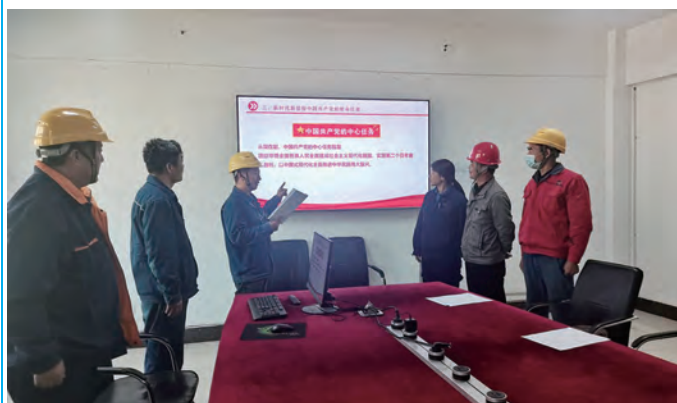
连日来，利海化工公司党总支通过理论中心组集中学习、二十大报告专题学习会、支部书记到一线部门宣讲等方式，确保党的二十大精神传达到每一个党支部、每一名党员干部和群众，推动党的二十大精神在利海落地见效。（顾孟徐宣）