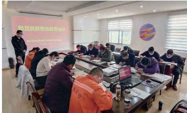
为加强新党员的再学习、再教育，不断提高新党员的政治素质。11月3日，华茂绿化工程公司围绕党的二十大精神，《党章》等内容对2020年以来新发展的14名党员进行思想教育集中培训。图为新党员进行知识测试答卷。（房金鹤）

抓好日常教育。组织全体党员、管理人员精读《习近平关于坚持和完善党和国家监督体系论述摘编》，撰写心得体会。每季度举办“神特大讲堂”活动，组织管理人员和班组长上讲台、上论坛，锻炼“说、写、做”能力。发动广大党员利用碎片时间，通过“学习强国”APP随时随地学，营造勤学善思氛围。开展“读原著悟原理奋进新征程”主题党日活动，引领广大党员进一步踔厉奋发、笃行不怠、凝心聚力、担当实干。（神特宣）