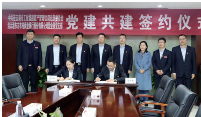
11月8日，资产管理公司党支部与连云港东方农商银行营业部党支部签订党建共建合作协议，双方将以学习贯彻党的二十大精神为主线，按照报告中“坚持把发展经济的着力点放在实体经济上”的总体要求，强化社会责任担当，形成“党建引领、银担协同、业务融合、互促进步”助力港城发展的新格局。（金作鹏）

今年以来，金桥制盐公司党委围绕思政教育、经营大局、队伍建设和党风廉政建设重点工作，全面推进党的建设。