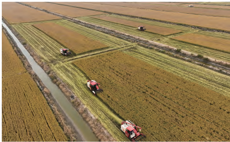
11月9日,伴随着机械轰鸣声,青口投资公司万亩耐盐碱水稻开镰收割,一台台收割机来回穿梭,田间地头一片繁忙的丰收景象,预计15天左右机收完毕。