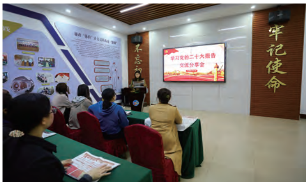
日前，台北投资公司女工委组织开展学习党的二十大精神交流分享活动，女工代表阅读报告原文，结合工作实际，分享心得体会、畅谈工作思路、谋划未来发展。（北工）

授课老师“专业讲”，在深学深悟上争做排头兵。将党的二十大精神贯穿于职工培训，邀请一批政治素质强、政策理论水平高的老师授课。同时积极鼓励职工增强学习积极性主动性，先学一步、深学一层、多悟一分，修炼过硬“内功”。（韩奇）