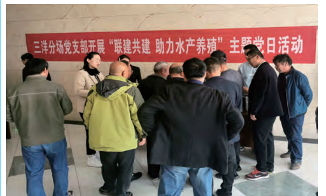
近日,青口三洋分场党支部联合黄沙坨社区党支部、永东水产养殖专业合作社党支部,开展“联建共建·助力水产养殖”主题党日活动,邀请相关科研院所和银行,现场为养殖户提供养殖技术咨询、低息贷款、低价饲料和生物制剂等综合服务。