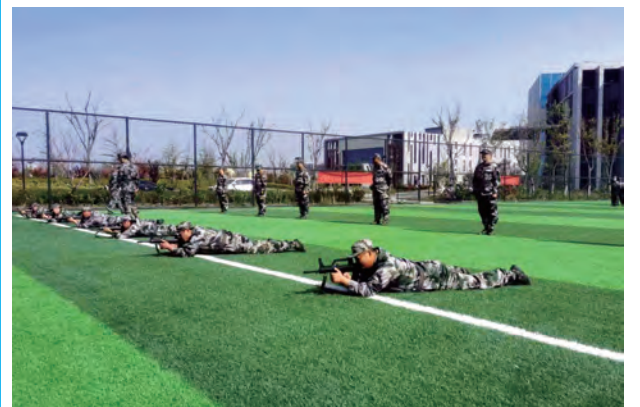
为深入贯彻习近平总书记关于大抓实战化训练的重要指示,不断提高民兵分队实战化训练水平,近日,灌西投资公司武装部集结各条战线上的骨干职工30人参加为期12天的军事训练,训练内容涵盖军事基本技能、专业技术等课目。