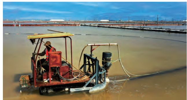
进入四月份,日晒制盐公司强化工艺、安全等基础管理提升重点工作,多措并举、铆足干劲,抢抓春季生产旺季,10 台抓盐机组昼夜高速运转,目前已抓盐 11 万吨。(西宣)

张六林指出,当前安全生产形势严峻,季节性安全风险增加,要紧绷安全生产弦,一刻不放松。他强调,各单位一把手要亲自部署抓落实,安全制度要再完善,责任落实要再细化,监督检查要再强化,避免一般化部署、原则性要求,找实、找准存在问题。二季度,要深入开展安全生产专项整治,抓好环境保护、做好防汛准备,强化应急管理,抓实安全生产各项工作,为集团奋战二季度、冲刺“双过半”打下坚实基础。(工宣 安全管理部)