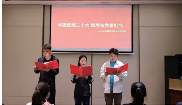
为贯彻落实党的二十大精神,引导党员干部筑牢拒腐防变的思想根基。近日,氨纶公司纪委组织开展“缅怀革命先烈·传承红色基因·汲取前行力量”清风氨纶主题党日,组织参观淮海战役纪念馆,并开展以“学思践悟二十大,踔厉奋发勇担当”为主题的学习研讨活动。