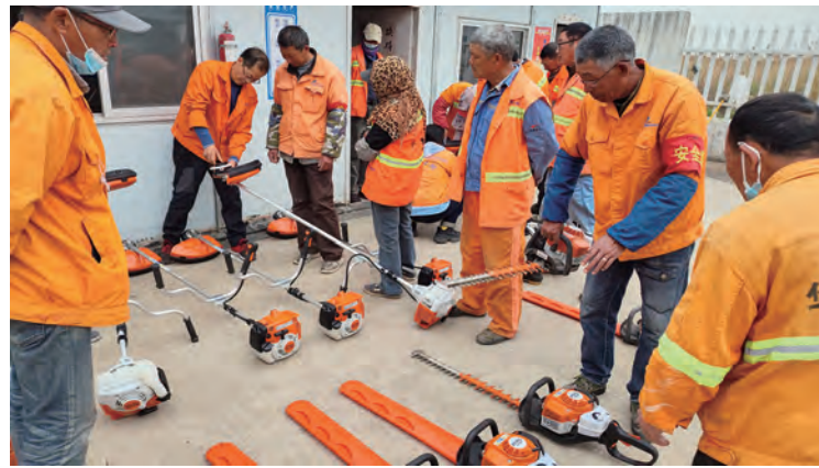
为进一步提高绿化人员机械安全操作和日常维护保养水平,近日,华茂裕祥养护公司组织绿化班员工开展绿化机械安全使用操作培训,切实增强绿化员工的安全操作技能及维护保养水平,为安全生产工作奠定良好基础。(张岩)

聚焦安全管理,确保筑牢安全之门。加强安全管理和培训,强化安全生产意识,认真落实“一岗双责”和全员安全生产责任制,加强对重点设备、关键部位、安全动态管控;组织开展好“隐患排查月”等活动,做好重点区域检查和监管;立足于防大汛、抗大潮、抗多灾,加强对海堤、闸站、排淡河道、盐廩等重点区域汛前排查,治理隐患,未雨绸缪做好防范工作。(许东彦 靳静)